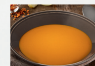
Linsencremesuppe mit Apfel (Art.-Nr. 12806)