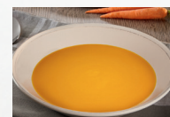
Karottencremesuppe (Art.-Nr. 12800)