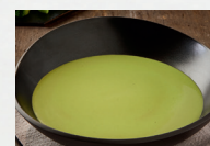
Brokkolicremesuppe (Art.-Nr. 12802)