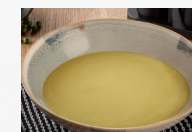
Erbsencremesuppe (Art.-Nr. 12804)