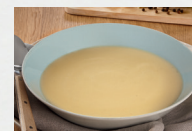
Geflügelcremesuppe (Art.-Nr. 12803)