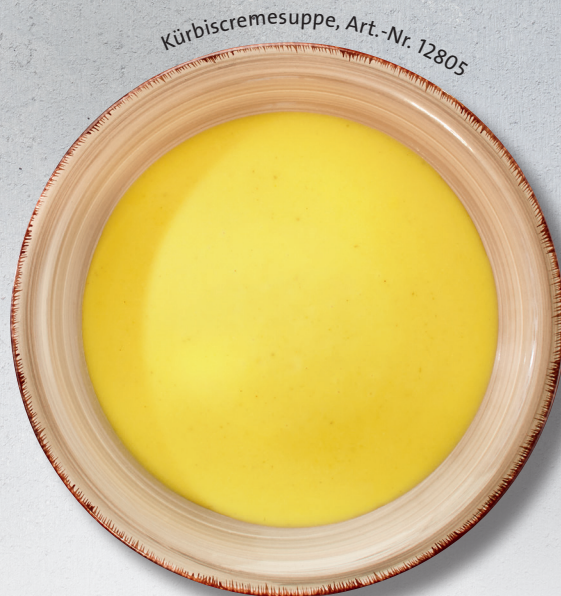
Kürbiscremesuppe, Art.-Nr. 12805

Bestellen Sie ganz nach Wunsch à la carte: