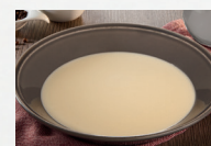
Spargelcremesuppe (Art.-Nr. 12801)