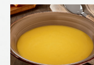
Kürbiscremesuppe (Art.-Nr. 12805)